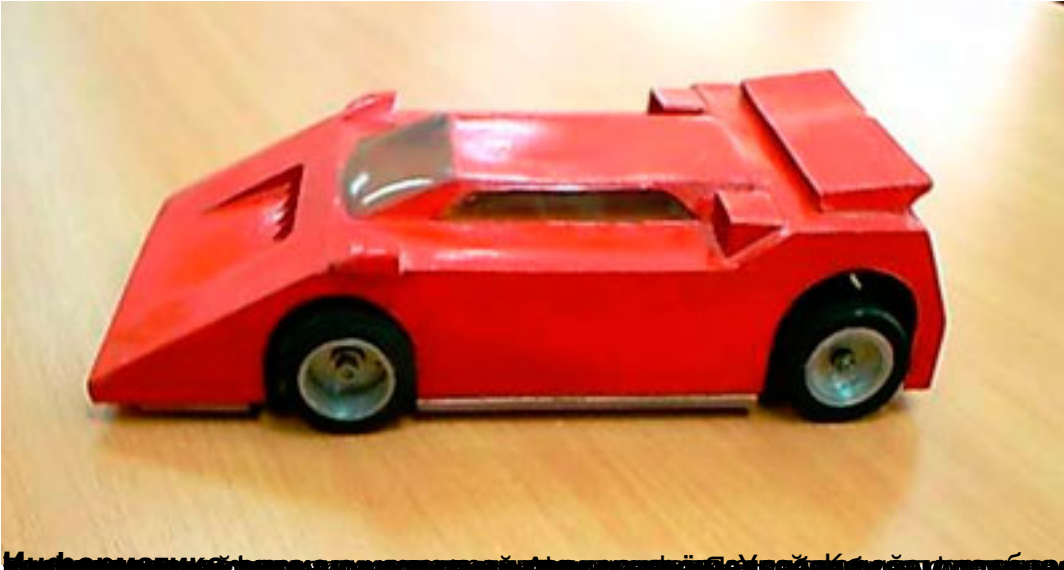
Модель автомобиля, изготовленная в рамках проекта «Мир будущего» в рамках программы «Техническое творчество»