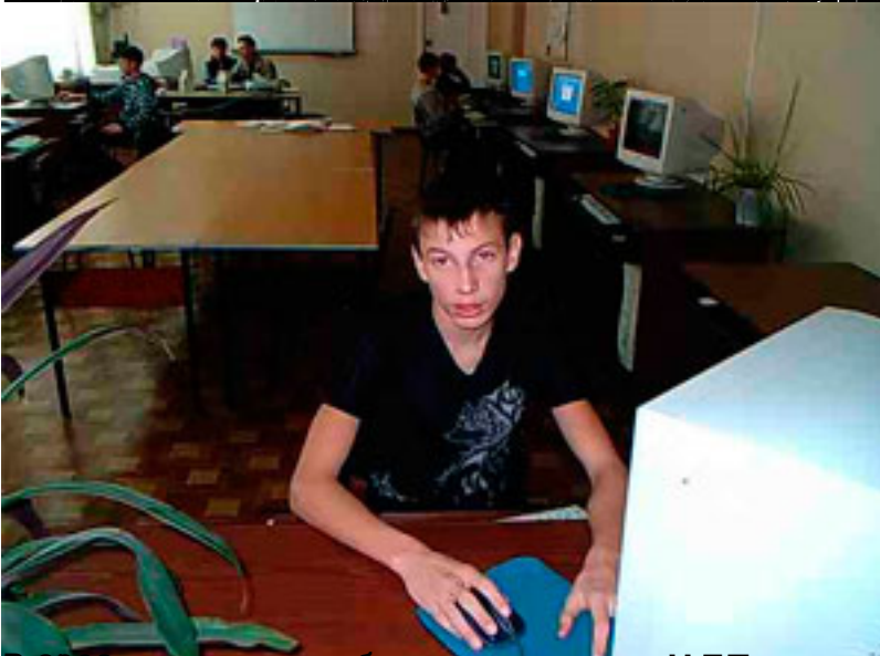
Работа в компьютерном классе в рамках проекта «Мир будущего» в рамках программы «Техническое творчество»